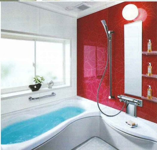
② ヤマハ ユニットバス(社名変更:トクラス)