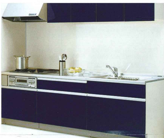
① クリナップ システムキッチン